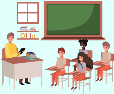
La salle de classe